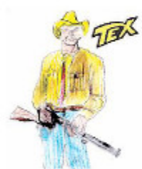
HITO Made Gabriele Cantoni

COME passano il loro tempo libero i nostri concittadini? Quali fumetti leggono? Con quali videogiochi trascorrono il loro tempo libero? Per avere le risposte abbiamo intervistato alcuni edicolanti e alcuni negozianti del centro della città. Parlando con il giovane esercente di «Comics World», un angolo di cultura nerd in via Cavour, è emerso che il manga (i fumetti giapponesi) vanno a ruba tra chi ha meno di trent'anni: un albo che racconta la storia dei pirati alla ricerca del favoloso tesoro che prende il nome di "One Piece" vende ad ogni uscita in media sessanta copie, mentre le avventure del ninja "Naruto" si attestano su circa cinquanta e le storie degli shinigami della serie "Bleach" arrivano a circa trenta copie. Secondo gli edicolanti di via Guidoni e di piazza Gagliardini, l'unico fumetto