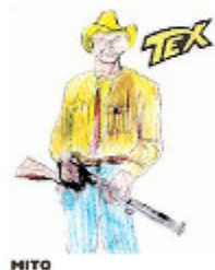
HITO Made Gabriele Cantoni

COME passano il loro tempo libero i nostri concittadini? Quali fumetti leggono? Con quali videogiochi trascorrono il loro tempo libero? Per avere le risposte abbiamo intervistato alcuni edicolanti e alcuni negozianti del centro della città. Parlando con il giovane esercente di «Comics World», un angolo di cultura nerd in via Cavour, è emerso che il manga (i fumetti giapponesi) vanno a ruba tra chi ha meno di trent'anni: un albo che racconta la storia dei pirati alla ricerca del favoloso tesoro che prende il nome di "One Piece" vende ad ogni uscita in media sessanta copie, mentre le avventure del ninja "Naruto" si attestano su circa cinquanta e le storie degli shinigami della serie "Bleach" arrivano a circa trenta copie. Secondo gli edicolanti di via Guidoni e di piazza Gagliardini, l'unico fumetto