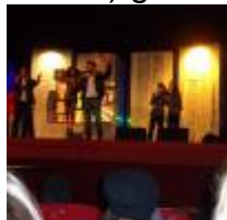
La Cittadella del Carnevale

I nostri studenti si sono entusiasmati, anche perché, prima di arrivare in teatro, hanno potuto effettuare una straordinaria visita alla Cittadella del Carnevale (che in questo periodo è chiusa) grazie alla cortesia di uno degli artisti.